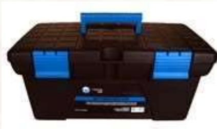
CAJA DE HERRAMIENTAS