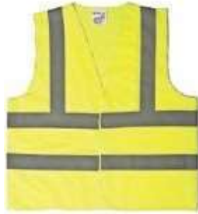
CHALECO REFLECTIVO EN POLYESTER, COLOR NEÓN.