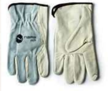
GUANTES TIPO INGENIERO DE CUERO, COLOR BLANCO.