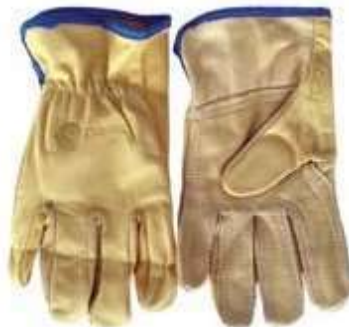
GUANTESVAQUETA INGENIERO REFORZADO, COLOR AMARILLO CLARO.