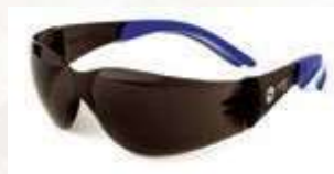
Gafa Narasport blue, lente oscuro, con antifog ANSI Z87.1