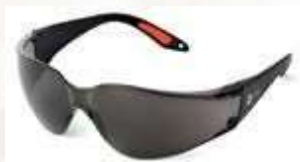
GAFA DE SEGURIDAD NARASPORT, LENTE OSCURO, CON ANTIFOG. ANSI Z87.1