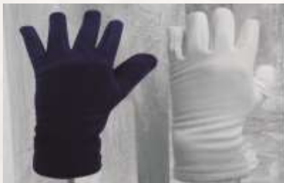
GUANTES EN TELA MICROFLEECE TÉRMICOS