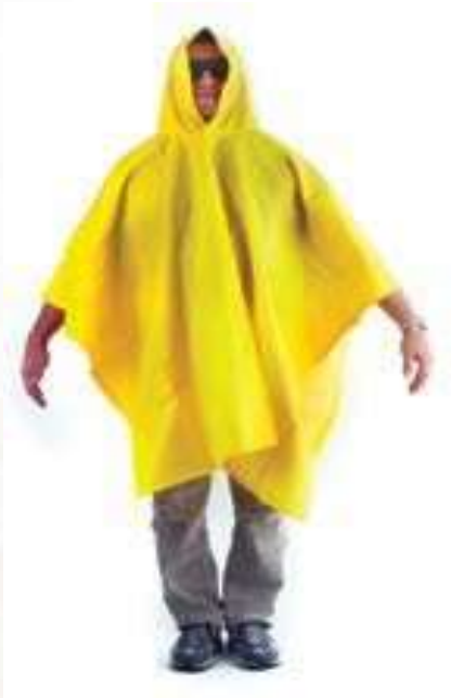
CAPA 1,45 x 2 m CALIBRE 16, COLOR AMARILLO.