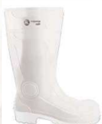
BOTAS BULLDOZER BLANCA, REFORZADA EN PUNTA Y TALÓN.