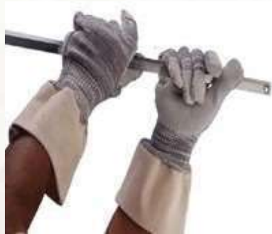
GUANTES POLYAMIDE PUÑO ABIERTO NIVEL DE CORTE No 5, PALMAY PUNTA DE DEDOS CUBIERTAS DE CUERO. COLOR GRIS. TALLA 9