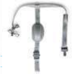
BARBUQUEJO PARA CASCO DIELÉCTRICO, 4 PUNTOS DE APOYO.