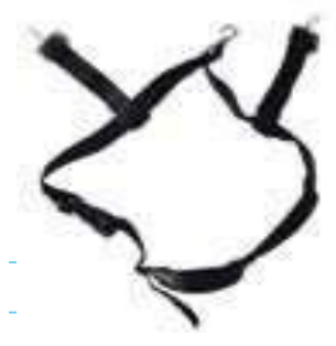
BARBUQUEJO PARA CASCO DIELÉCTRICO, 3 PUNTOS DE APOYO.