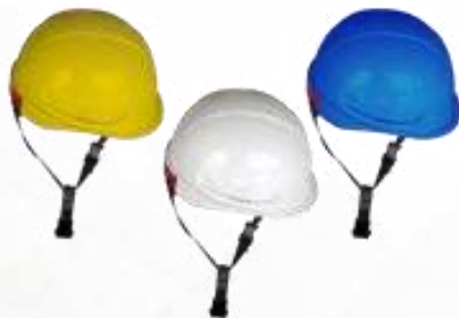
CASCO MINNING, DIELÉCTRICO, SIN VENTILACIÓN, COLORES: AMARILLO, BLANCO Y AZUL. ANSI Z89.1