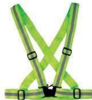
ARNÉS REFLECTIVO ELÁSTICO, COLOR NEÓN.