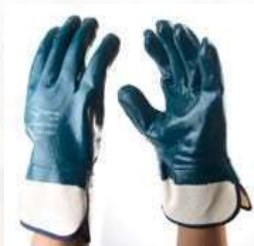
GUANTES HEAVY DUTY NITRILO, PUÑO ABIERTO- ALGODÓN NITRILO, COLOR AZUL CON BLANCO. TALLA 9, 10