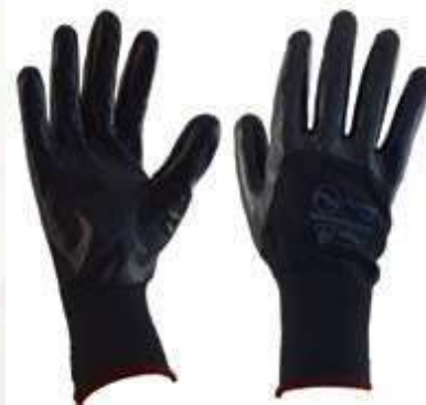
GUANTESTACTIL NITRILO - NYLON NITRILO, PUÑO ELÁSTICO CERRADO, COLOR NEGRO. TALLA 8, 9, 10.