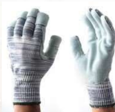
GUANTES DYNEEMA® LEATHER-POLYESTER, PUÑO CERRADO, NIVEL DE CORTE No 5, PALMAY PUNTA DE DEDOS CUBIERTAS DE CUERO, COLOR GRIS. TALLA 9.