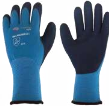
GUANTES HYCOOL®, DOBLE RECUBRIMIENTO DE LÁTEX. COLOR AZUL. TALLAS 8 Y 9.