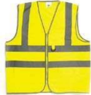
CHALECO REFLECTIVO CLIMA CÁLIDO CON CREMALLERAY BOLSILLO, COLOR NEÓN.