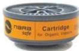
CARTUCHO FILTRANTE A1 (BROWN, GASES Y VAPORES ORGANICOS), PARA RESPIRADOR NA7200300. CE EN 14387:2004