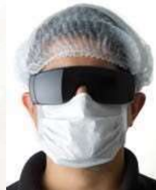
GORRO PLEGADO. BOLSA DE 100 UNIDADES