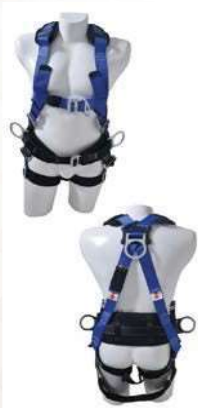
ARNÉS MULTIPROPÓSITO CON FAJA LUMBAR. ANSI Z359.1 (2007)