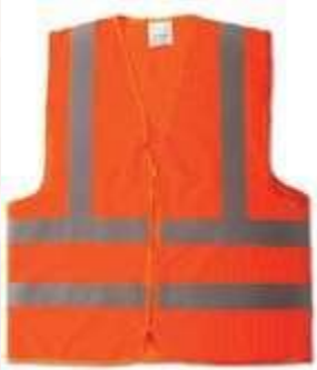
CHALECO REFLECTIVO CLIMA CÁLIDO, CON CREMALLERA, COLOR NARANJA.