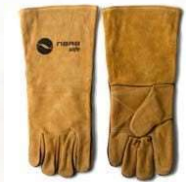
GUANTES CARNAZA SOLDADOR 16" COSIDO EN KEVLAR REFORZADO EN LA PALMA, COLOR MARRÓN.