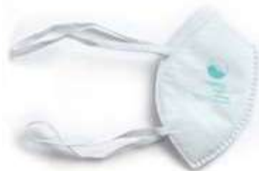
RESPIRADOR FABRICADO BAJO EL ESTÁNDAR N95,PAQUETE DE 5 UNIDADES,COLORES NEGRO Y BLANCO.