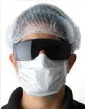
TAPA BOCA RECTANGULAR DESECHABLE, CAJA DE 50 UNIDADES