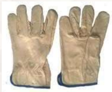
GUANTES TIPO INGENIERO 100% CUERO, COLOR BEIGE.