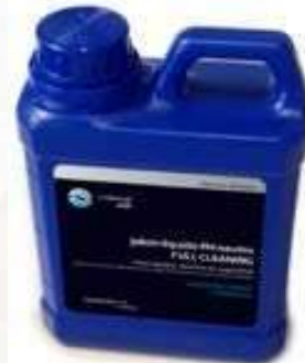
JABÓN PH NEUTRO FULL CLEANING