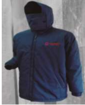
CHAQUETA TERMICA CAMPERO ELABORADA EN TELA CAMPERO DE LAFAYETTE, (ANTI- RASGADO),