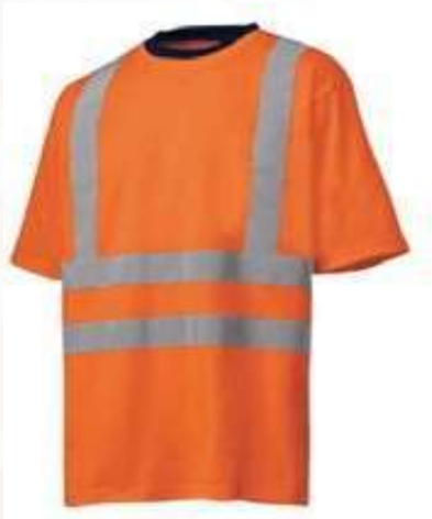
CAMISetas DOTACION Y REFLECTIVA MANGA CORTA, CUELLO REDONDO Y EN "V" TALLA S, M, L, XL Y XXL