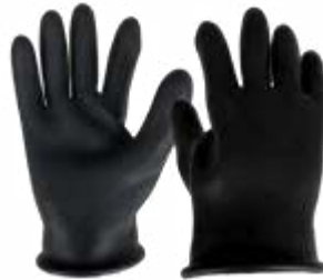
GUANTES LADRILLEROS, CALIBRE 50 COLOR NEGRO. TALLA 9, 10.