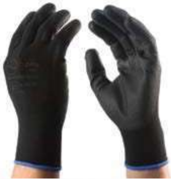
GUANTES CONFORT PU, NYLON POLIURETANO, PUÑO CERRADO, COLOR NEGRO. TALLA 7, 8, 9, 10