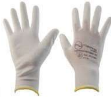
GUANTES NYLON PU, POLIURETANO, PUÑO CERRADO COLOR BLANCO. TALLA 7, 8, 9