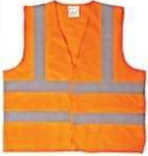
CHALECO REFLECTIVO EN POLYESTER, COLOR NARANJA.