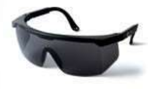
GAFA DE SEGURIDAD LENTE OSCURO, CON ANTIFOG. ANSI Z87.1