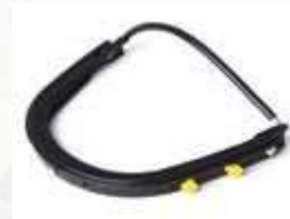
ADAPTADOR PARA CASCO VISOR.