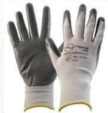
GUANTES NARAFLEX DE NYLON BLANCO, RECUBIERTO EN NITRILO EN LA PALMA, PUÑO CERRADO, COLOR BLANCO CON GRIS. TALLA 7, 8, 9