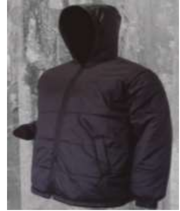
CHAQUETA TERMICA ELABORADA EN TELA 30100, 95% IMPERMEABLE TRES CAPAS