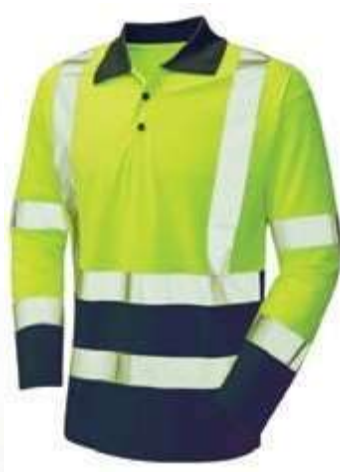
CAMISetas TIPO POLO REFLECTIVAS MANGA CORTA Y MANGA LARGA, TALLAS S, M, L, XL Y XXL