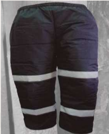
PANTALON TERMICO TELA CAMPERO CON O SIN REFLECTIVO