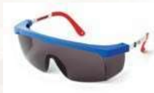
GAFA DE SEGURIDAD LENTE OSCURO, CON ANTIFOG. ANSI Z87.1