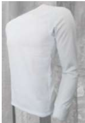
CONJUNTO CAMISA Y PANTALON ROPA INTERIOR EN TELA TITANIUM TERMICA