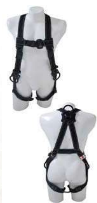
ARNÉS MULTIPROPÓSITO 3 ARGOLLAS D, EN KEVLAR. ANSI Z359.1 (2007)