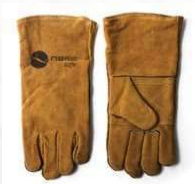
GUANTES CARNAZA SOLDADOR 14" COSIDO EN KEVLAR REFORZADO EN LA PALMA, COLOR MARRÓN.