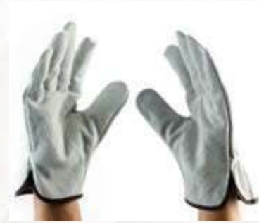
GUANTES INGENIERO DRIVER GLOVES, PALMAY DORSO EN CARNAZA BLANCA PARA MAYOR RESISTENCIA. COLOR GRIS CLARO