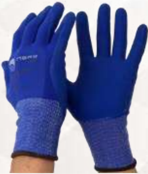
GUANTES BLUE SUPER FLEX NYLON, NITRILO, PU, PUÑO CERRADO, COLOR AZUL. TALLA 8, 9, 10.