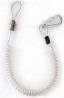
PORTA HERRAMIENTA, GUAYA ELÁSTICA.