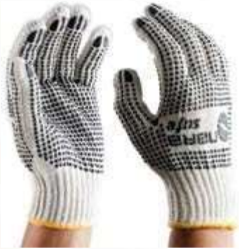
GUANTES COTTON PVC DOTS COLOR BLANCO CON PUNTOS NEGROS.