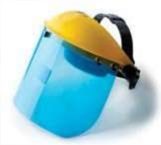
CARETA ESMERIL CON RATCHET. ANSI Z87.1