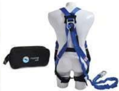
KIT BÁSICO (ARNÉS MULTIPROPÓSITO 1 ARGOLLA, ESLINGA CON ABSORBEDOR, MALETÍN). ANSI Z359.1 (2007)