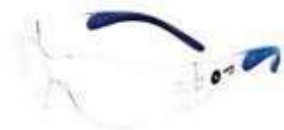
Gafa Narasport blue, lente claro, con antifog ANSI Z87.1