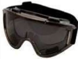
MONOGAFA CON LENTE OSCURO, VENTILACIÓN INDIRECTA, CON ANTIFOG. ANSI Z87.1