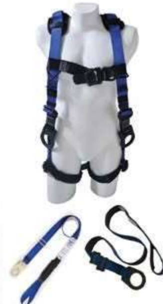
KIT DIELECTRICO (ARNÉS MULTIPROPÓSITO DIELECTRICO 4 ARGOLLAS, ESLINGA DIELECTRICA CON ABSORBEDOR DE ENERGÍA Y PUNTO FIJO DIELECTRICO)