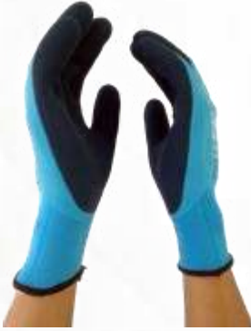
GUANTES NYLON-COOL®, DOBLE RECUBRIMIENTO DE LÁTEX PALMAY DORSO, PUÑO CERRADO, COLOR AZUL. TALLAS 8 Y 9.