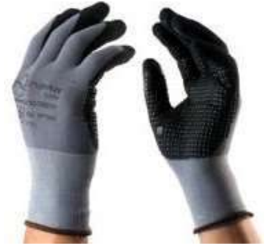
GUANTES SUPER FLEX NITRILO - NYLON NITRILO, PUÑO CERRADO, COLOR GRIS CON NEGRO. TALLAS 8, 9, 10.