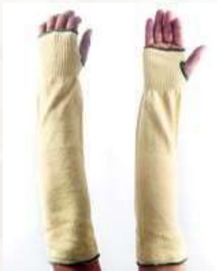
MANGA SLEEVES DE FIBRA DE KEVLAR DE 45 cm, COLOR AMARILLO