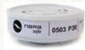
CARTUCHO P3 MÁXIMA EFICIENCIA PARA RESPIRADOR NA7200300. CE EN 14387:2004