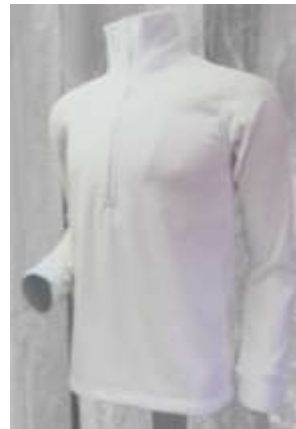
CONJUNTO CAMISA Y PANTALON ROPA INTERIOR EN TELA PLUSH FLEECE TERMICA