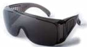
Gafa de Seguridad lente oscuro, sin antifog. ANSI Z87.1