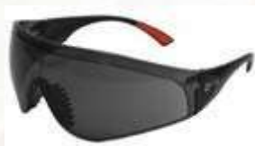
GAFA DE SEGURIDAD NARA CONFORT, LENTE OSCURO, CON ANTIFOG. ANSI Z87.1