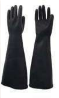
GUANTE INDUSTRIAL LONG, CALIBRE 65 – 20". COLOR NEGRO. TALLA 9, 10.