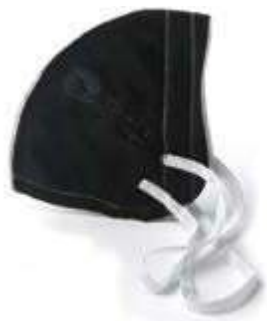
MASCARILLA PAQUETE DE 5 UNIDADES COLORES NEGRO,BLANCO Y AZUL.