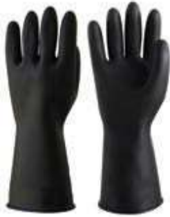
GUANTES INDUSTRIAL CALIBRE 35, USO INDUSTRIAL. TALLA 7, 7.5, 8, 8.5, 9, 10