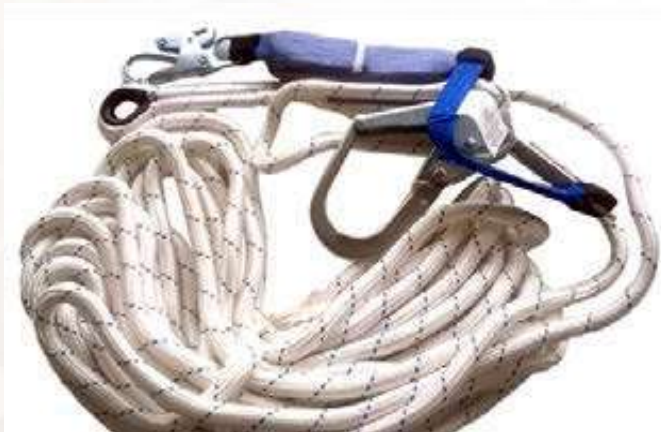
KIT LÍNEA DE VIDA, CON ABSORBEDOR, FRENO, PUNTO FIJO, MOSQUETON Y ESLINGA ANSI Z359.1 (2007) TRES PRESENTACIONES EN 20 METROS, 30 METROS Y 50 METROS.