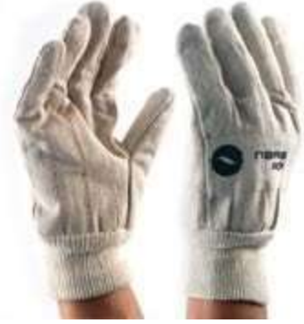
GUANTES PETROLERO, PUÑO CERRADO, 100% ALGODÓN, COLOR BLANCO.