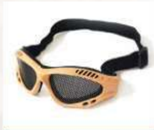
GAFA DE SEGURIDAD CON VISOR TIPO MALLA