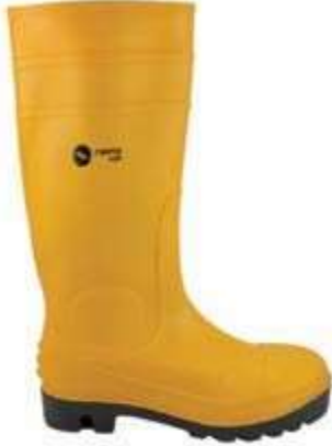
BOTAS PVC, PUNTERA REFORZADA, SUELA NEGRA, COLOR AMARILLO.