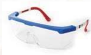
GAFA DE SEGURIDAD LENTE CLARO, CON ANTIFOG. ANSI Z87.1