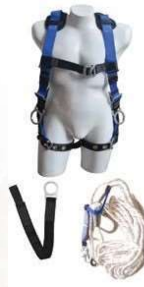
LÍNEA DE VIDA PLUS (KIT LÍNEA DE VIDA, ARNÉS MULTIPROPÓSITO, CONTRAPESO, PUNTO FIJO).