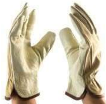
GUANTES DE INGENIERO PIG GRAIN, DORSO DE CUERO DE CERDO, COLOR AMARILLO CLARO.