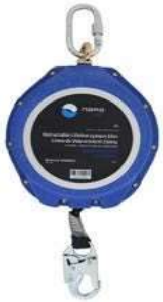
YOYO DE 6 m PARA PROTECCIÓN. ANSI Z359.1 (2007)