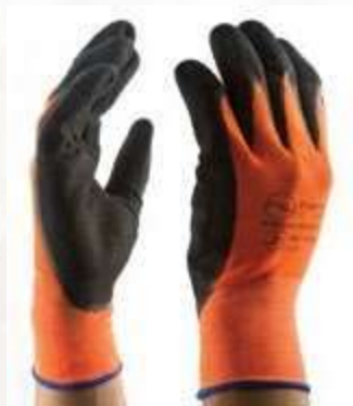
GUANTES SANDY POLYESTER LÁTEX, COLOR NEGRO CON NARANJA TALLAS 7, 8, 9, 10.