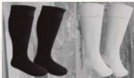
MEDIAS TÉRMICAS EN TELA MICRO FLEECE