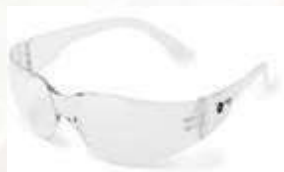
Gafa de Seguridad Narasport, lente claro, sin antifog. ANSI Z87.1