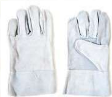
GUANTES CARNAZA PALMAY DORSO, PUÑO ABIERTO, COLOR GRIS.