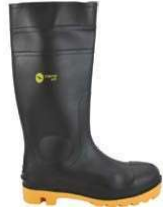
BOTAS PVC, PUNTERA REFORZADA, SUELA AMARILLA, COLOR NEGRO.