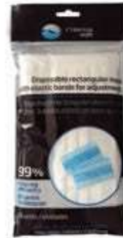
TAPABOCA RECTANGULAR DESACHABLE, PAQUETE DE 10 UNIDADES