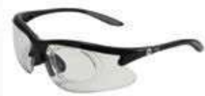
GAFA DE SEGURIDAD PARA LENTE FORMULADO. ANSI Z87.1