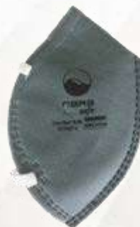
RESPIRADOR FABRICADO BAJO EL ESTÁNDAR N95, CARBÓN ACTIVADO PAQUETE DE 5 UNIDADES,COLOR GRIS.