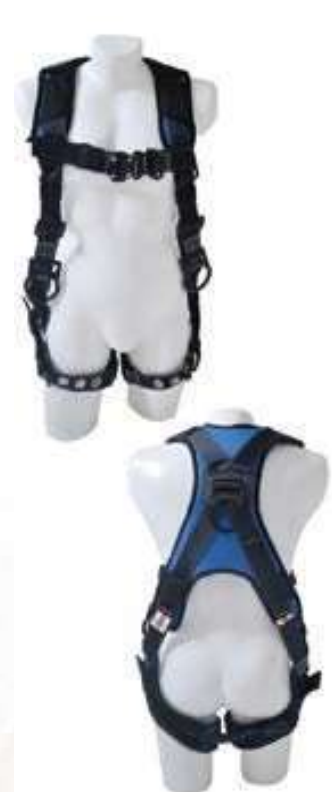
ARNÉS MULTIPROPÓSITO 4 ARGOLLAS D. ANSI Z359.1 (2007)