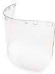
REPUESTO VISOR, PARA CARETA.