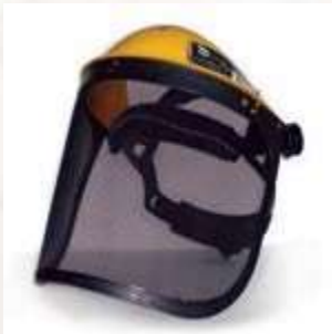
CARETA CON MALLA METÁLICA, SOPORTE AJUSTABLE.