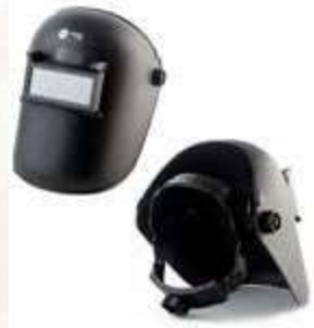
CARETA PROTECTORA PARA SOLDAR CON VENTANA. ANSI Z87.1