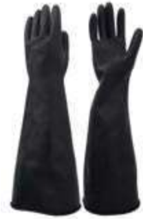
GUANTE INDUSTRIAL LONG, CALIBRE 35 – 20". COLOR NEGRO. TALLA 9, 10.