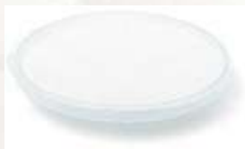
ADAPTADOR PRE FILTRO PARA CARTUCHOS DEL RESPIRADOR NA7200300 PAQUETE X 20 UNIDADES. CE EN 14387:2004