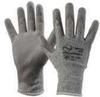
GUANTES CUT RESISTEN, RECUBRIMIENTO EN PU, NIVEL DE CORTE 3, COLOR GRIS. TALLA 8, 9