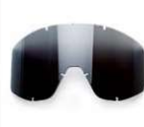
REPUESTO PARA MONOGAFAS. VISOR OSCURO. ANSI Z87.1