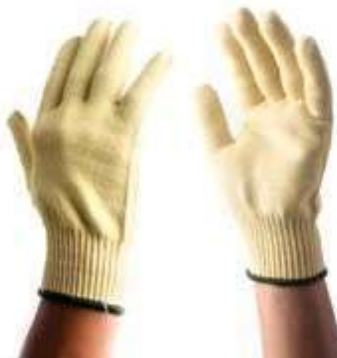
GUANTES KEVLAR REINFORCEMENT, PUÑO ELÁSTICO CERRADO, NIVEL DE CORTE No 4, REFORZADO ENTRE LOS DEDOS. COLOR AMARILLO CON BLANCO. TALLA 9.