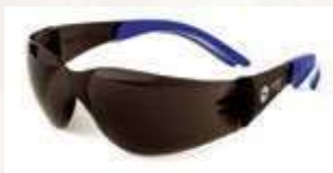
Gafa Narasport blue, lente oscuro, sin antifog ANSI Z87.1