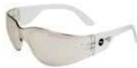
GAFA DE SEGURIDAD NARASPORT IN DOOR OUT DOOR. SIN ANTIFOG. ANSI Z87.1