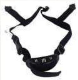
BARBUQUEJO PARA CASCO DIELÉCTRICO, 3 PUNTOS DE APOYO, ELÁSTICO.