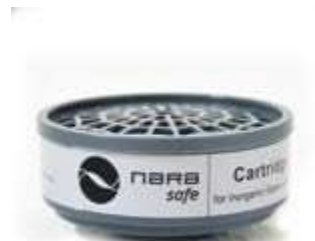
CARTUCHO FILTRANTE B1 (GREY, GASES Y VAPORES INORGANICOS), PARA RESPIRADOR NA7200300. CE EN 14387:2004