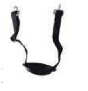
BARBUQUEJO PARA CASCO DIELÉCTRICO, 2 PUNTOS DE APOYO.