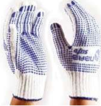
GUANTES POLYESTER PVC DOTS, COLOR BLANCO CON PUNTOS AZULES.