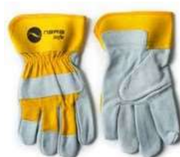
GUANTES CARNAZA DRIL 10.5", COLOR AMARILLO CON BLANCO.