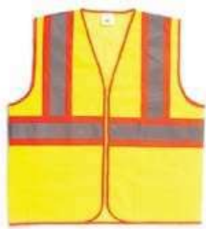
CHALECO REFLECTIVO CLIMA CÁLIDO, TEJIDO EN REJILLA (MALLA) CON CREMALLERA, COLOR NEÓN.