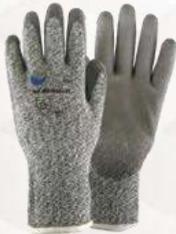
GUANTES CUT RESISTEN, RECUBRIMIENTO EN PU, NIVEL DE CORTE 5, COLOR GRIS.