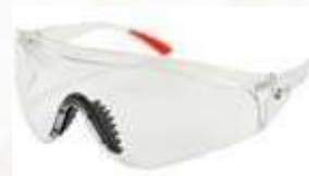
GAFA DE SEGURIDAD NARA CONFORT, LENTE CLARO, CON ANTIFOG. ANSI Z87.1