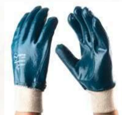
GUANTES HEAVY DUTY NITRILO, PUÑO CERRADO - ALGODÓN NITRILO, COLOR AZUL CON BLANCO. TALLA 9, 10.