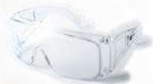
Gafa de Seguridad lente claro, sin antifog. ANSI Z87.1