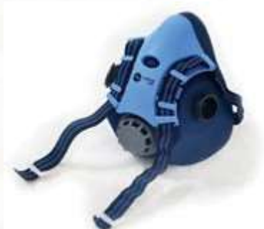
RESPIRADOR REUSABLE, MEDIA CARA, DOBLE FILTRO. CE EN 140:1998 / CE EN 14387:2004