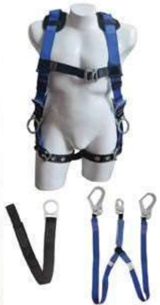
KIT PETROLERO (ARNÉS MULTIPROPÓSITO 4 ARGOLLAS, ESLINGA EN "Y" CON ABSORBEDOR, PUNTO FIJO).