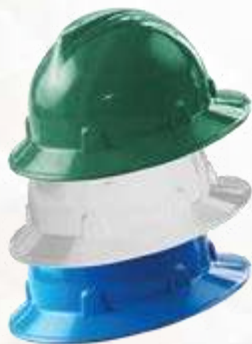
CASCO, TIPO SAFARI, ALA COMPLETA COLORES: VERDE, BLANCO Y AZUL. ANSI Z89.1