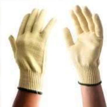
GUANTES KEVLAR POLYIMIDE, PUÑO CERRADO, NIVEL DE CORTE No 4, CUBIERTA INTERNA DE POLIAMIDA, COLOR AMARILLO. TALLA 9.