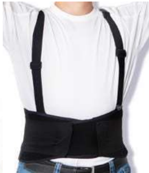
FAJA DE PROTECCIÓN LUMBAR, SOPORTE DE ESPALDA. TALLAS M, L, XL