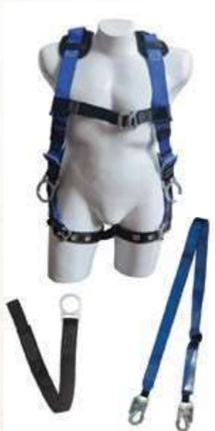
KIT CONSTRUCTOR (ARNÉS MULTIPROPÓSITO 4 ARGOLLAS, ESLINGA CON ABSORBEDOR, PUNTO FIJO).