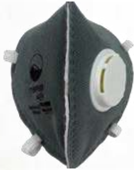
RESPIRADOR FABRICADO BAJO EL ESTÁNDAR N95, CARBÓN ACTIVADO CON VÁLVULA, PAQUETE DE 5 UNIDADES, COLOR GRIS.