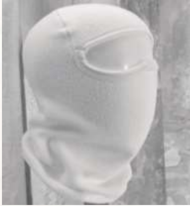
PASAMONTAÑAS TERMICO TELA FLEECE DE LAFAYETTE