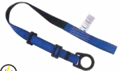
CONECTOR DE ANCLAJE 2 ARGOLLAS, DE 1,8 m. ANSI Z359.1 (2007)