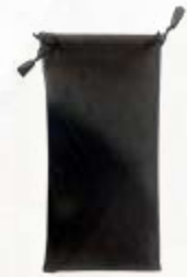
FUNDA PARA GAFAS, COLOR NEGRO.