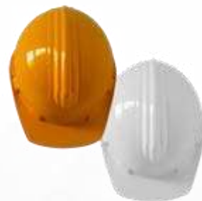
CASCO TIPO CAPITÁN, ECONÓMICO, COLORES: AMARILLO Y BLANCO