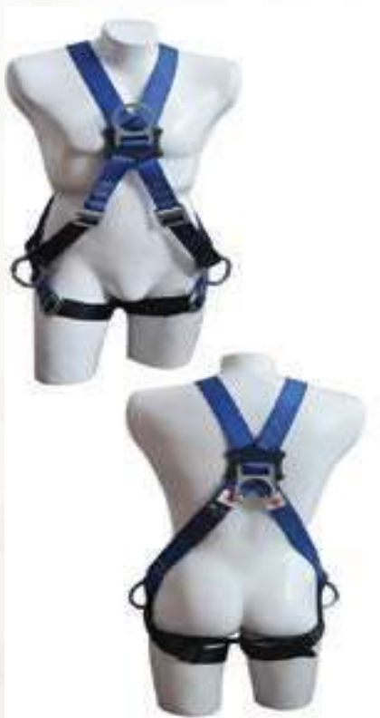
ARNÉS MULTIPROPÓSITO 4 ARGOLLAS, EN X. ANSI Z359.1 (2007)