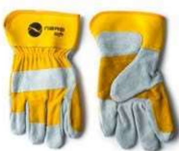
GUANTES CARNAZA DRIL 10.5" CON REFUERZO, COLOR AMARILLO CON BLANCO.