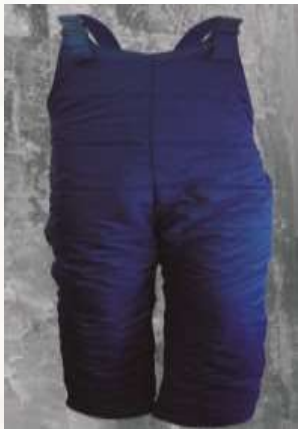
PANTALÓN OVEROL 30100 Y TELA CAMPERO LAFAYETTE DISEÑO TIPO PESQUERO