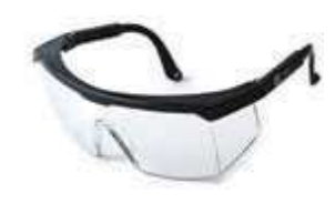
GAFA DE SEGURIDAD LENTE CLARO, CON ANTIFOG. ANSI Z87.1