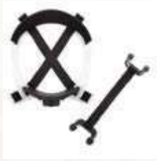
TAFILETE DE REPUESTO PARA CASCO DIELÉCTRICO, 6 PUNTOS DE APOYO.