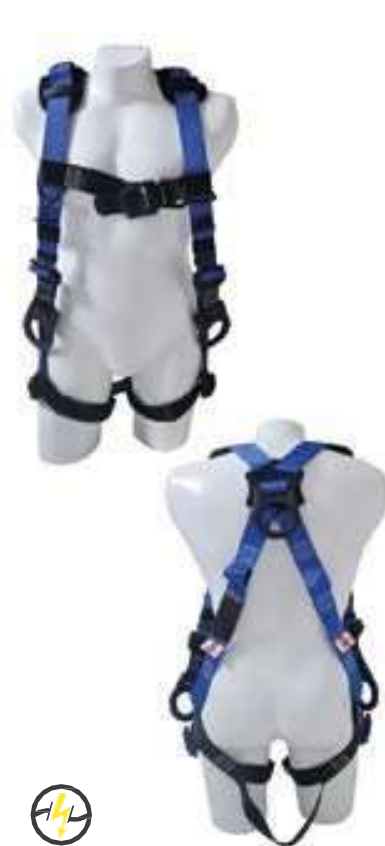
ARNÉS MULTIPROPÓSITO DIELÉCTRICO 4 ARGOLLAS D. ANSI Z359.1 (2007)