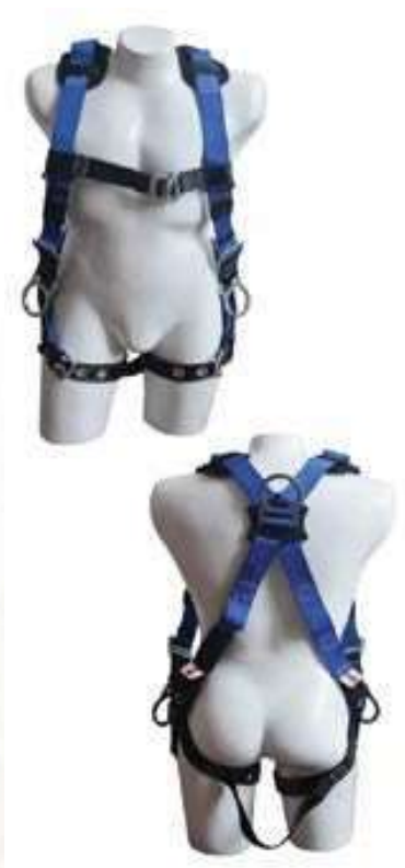
ARNÉS MULTIPROPÓSITO 4 ARGOLLAS D. ANSI Z359.1 (2007)