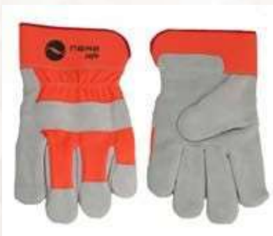
GUANTES CARNAZA DRIL 10.5", COLOR NARANJA