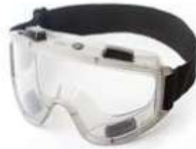
MONOGAFA CON LENTE CLARO, VENTILACIÓN INDIRECTA, CON ANTIFOG. ANSI Z87.1