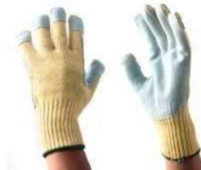
GUANTES KEVLAR LEATHER- POLYESTER, PUÑO CERRADO, NIVEL DE CORTE No 4, PALMAY PUNTA DE DEDOS CUBIERTAS DE CUERO, COLOR AMARILLO CON GRIS. TALLA 9.