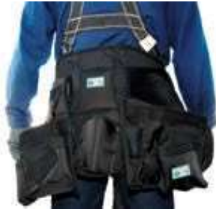
FAJA LUMBAR CON PORTAHERRAMIENTAS.