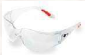
GAFA DE SEGURIDAD NARASPORT, LENTE CLARO, CON ANTIFOG. ANSI Z87.1