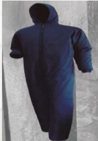
OVEROL ENTERIZO EN TELA CAMPERO DE LAFAYETTE, Y TELA 30100 NACIONAL(ANTI- RASGADO), TRES CAPAS IMPERMEABLE