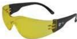
GAFA DE SEGURIDAD NARASPORT AMBAR, SIN ANTIFOG. ANSI Z87.1