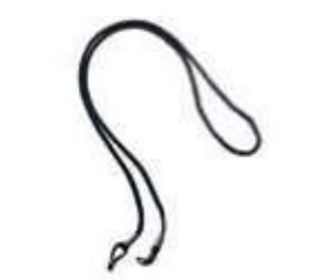
CORDÓN SUJETADOR PARA GAFA