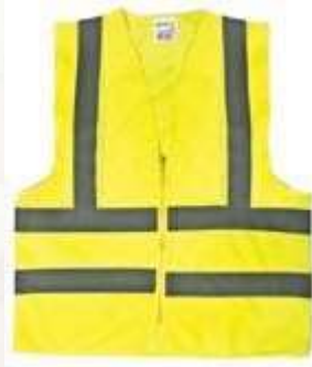
CHALECO REFLECTIVO CLIMA CÁLIDO, CON CREMALLERA, COLOR NEÓN.