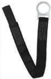
CONECTOR DE ANCLAJE 1 ARGOLLA, DE 0,90 m. ANSI Z359.1 (2007)