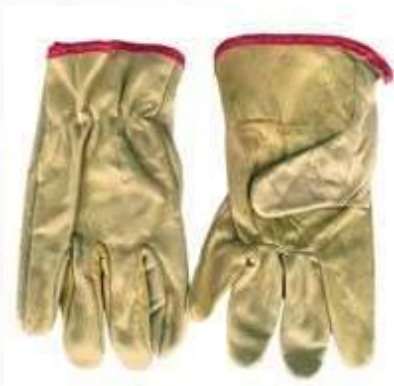
GUANTESVAQUETA INGENIERO SENCILLO, COLOR AMARILLO CLARO.