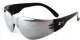
GAFA DE SEGURIDAD NARASPORT, LENTE ESPEJADO, SIN ANTIFOG. ANSI Z87.1