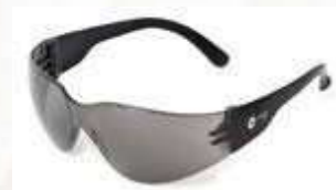
Gafa de Seguridad Narasport, lente oscuro, sin antifog. ANSI Z87.1