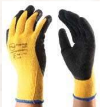
GUANTES CRINKLE LÁTEX, PUÑO EN ALGODÓN, PALMA CUBIERTA DE LÁTEX NATURAL, COLOR NEGRO CON AMARILLO. TALLAS 8, 9, 10.