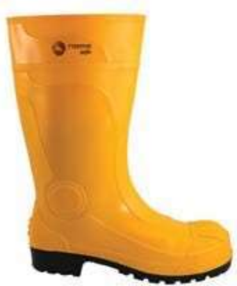
BOTAS BULLDOZER AMARILLA, REFORZADA EN PUNTA Y TALÓN.