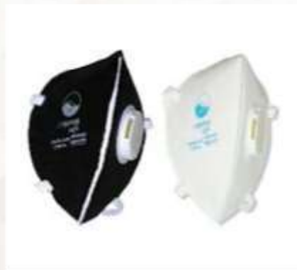
RESPIRADOR FABRICADO BAJO EL ESTÁNDAR N95, CON VÁLVULA,PAQUETE DE 5 UNIDADES,COLORES NEGRO Y BLANCO.