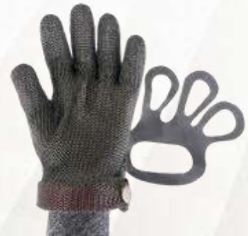
GUANTE PROTECCIÓN AL CORTE INOX. TALLA S, M, L.